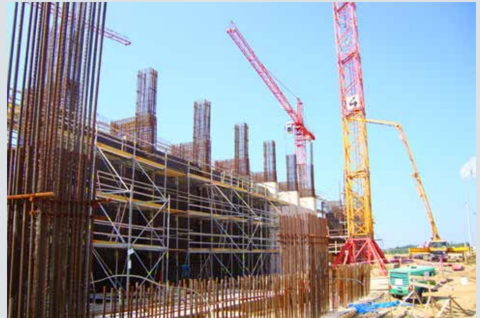
Stavba skladu vyhořelého jaderného paliva v Temelíně.