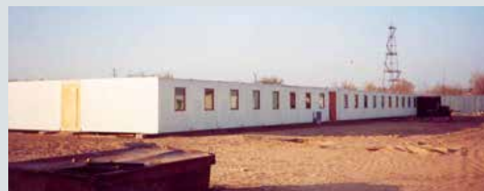
Ubytování v Turkmenistánu pro pracovníky a pracovníce z PSG a ČKD, které Ivana Horská vedla.