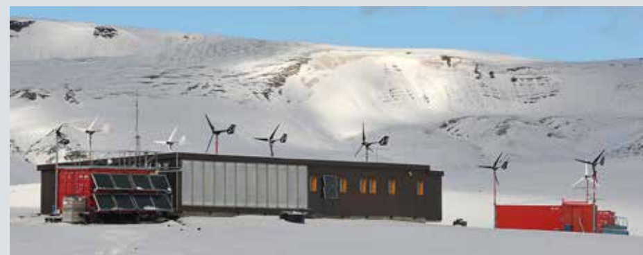
Česká vědecká stanice J. G. Mendela na ostrově Jamese Rosse.