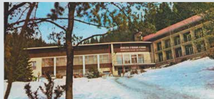
Rekreační středisko Stavbař na Miloňově ve Velkých Karlovicích, 80. léta 20. století.