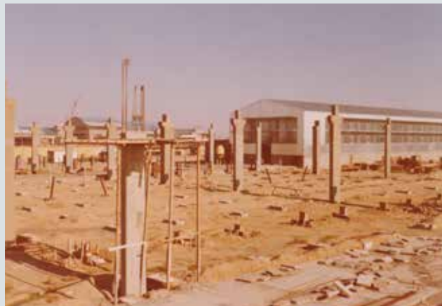
Rozestavěná hala pro výrobu železobetonových prefabrikátů v Sýrii, konec 70. let 20. století.