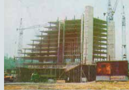
Stavba Domu rekreace ROH, dnešní Hotel Pyramida, v Praze na Dlabačově.

vynikající odborníci, kteří udělali maximum, aby sehnali pro své zaměstnance práci. Proto se jejich podřízení, jako třeba já a moji kolegové, snažili svou práci vykonávat zodpovědně a bez chyb. Na závěr dodám, že jsem se díky práci v PSG na jednom školení seznámil s mojí manželkou, což je pro mě velký životní bonus!