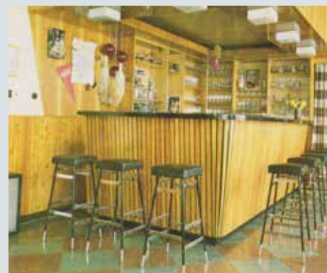
Interiér střediska Stavbař, 80. léta 20. století.