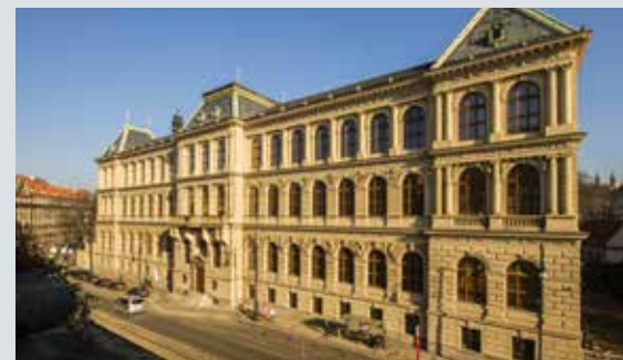
Budova Uměleckoprůmyslového musea po rekonstrukci.

Za klíčovou hodnotu ve stavebnictví považuju férovost. Investor, projektant a dodavatel prostě musí táhnout za jeden provaz. Pokud k sobě přistupují jako k soupeřům, dopadne to špatně. Důležité je i celkové nadšení pro věc a jasně stanovený cíl, jak by projekt měl běžet, aby byl zákazník spokojený. Na všech stavbách, kterými jsem prošel, bylo nejdůležitější to, jaký se sešel kolektiv a jeho ochota se semknout a udělat maximum pro to, aby vše dopadlo co nejlépe.